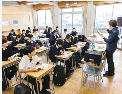
全員に目の届きやすい 少人数クラス編成

中学の学習内容をしっかり、じっくり、学びます。 グループ学習、アクティブラーニングなどを通して 思考力や発信力を高めていきます。