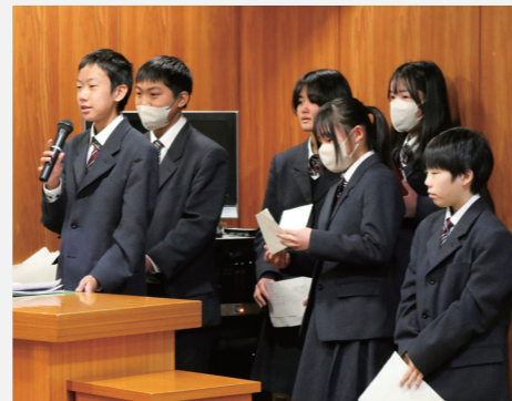
中学の総合学習で基礎を固め、 高校の探究学習で力を飛躍させる

ネイティブ教師によるオールイングリッシュの授業で実践的な英語力を身につけます。「分かる・伝わる」経験から自信が生まれ、英語を学ぶ意欲が高まります。また日本語教師の授業では、基礎的な学力を身につけます。