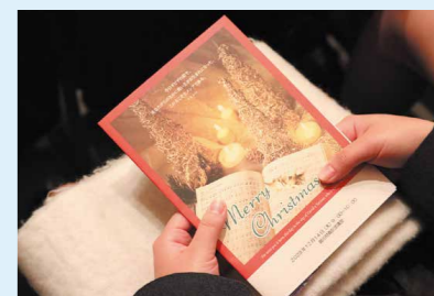
クリスマス礼拝(12月)