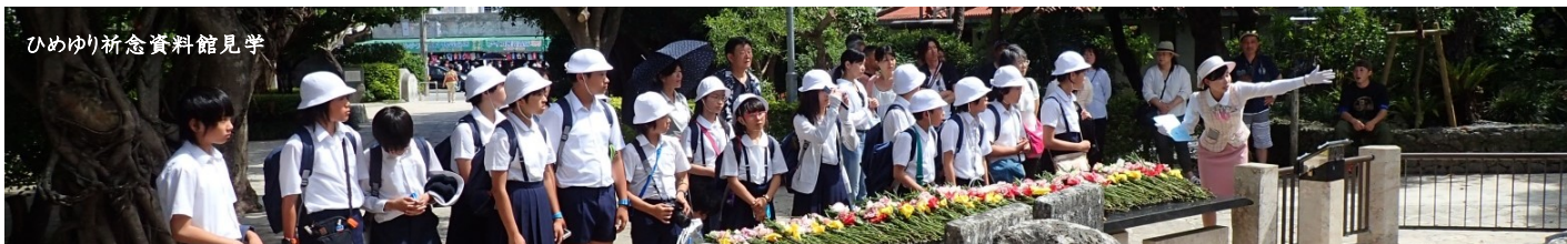
ひめゆり祈念資料館見学

9月16日(金)9:00～10:30 小学校グレーニアホールにて 9月17日(土)9:40～11:00 賀川村島記念講堂にて