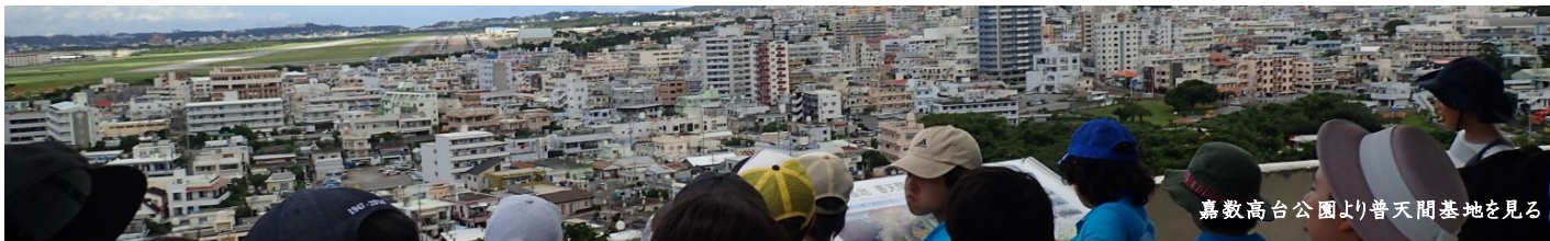
嘉数高台公園より普天間基地を見る