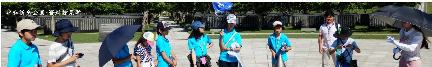
平和祈念公園・資料館見学